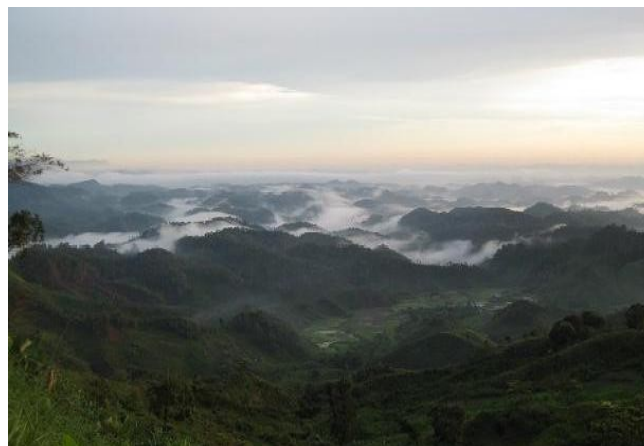
levée de soleil